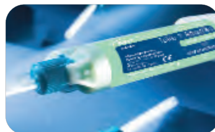
Take 1 Advanced Bite Registration

Zawartość: 2 x 50 ml naboje z masą Bite Registration, podajnik, 6 dużych końcówek mieszających, 6 końcówek wewnętrznych.