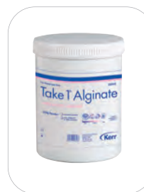
Take 1 Alginate, 500g

20 x 450 g torebek z masą, 5 miarek do płynu i 5 miarek do proszku.