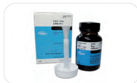
V.P.S. Adhesive 59 ml