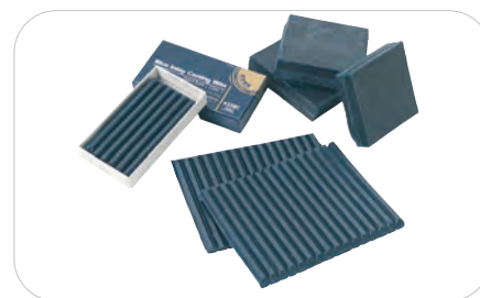
Blue Inlay Casting Wax