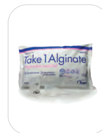
Take 1 Alginate, 450g