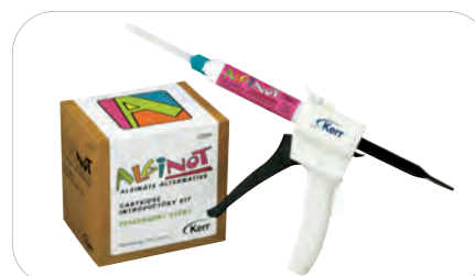
AlgiNot w nabojach, zestaw wprowadzający 33034

AlgiNot 6 x 300 ml pasty bazowej, 6 x 62 ml katalizatora 33041