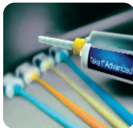
Take 1 Advanced