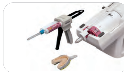
Kerr Volume, automatyczny mieszalnik do mas wyciskowych 33171