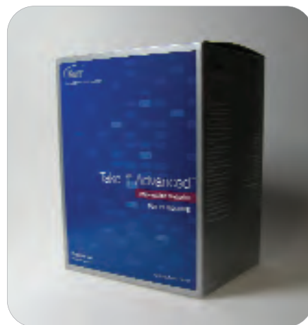
Take 1 Advanced Putty Volume Regular Set 34145