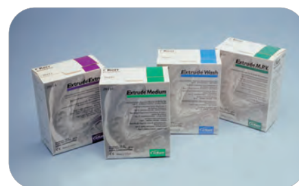
Extrude Masa fioletowa, ciemnozielona, jasnoniebieska, zielona

2 x 520 ml słoiki z masą, miarki do masy, folia separacyjna