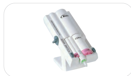
Kerr Volume Mixer