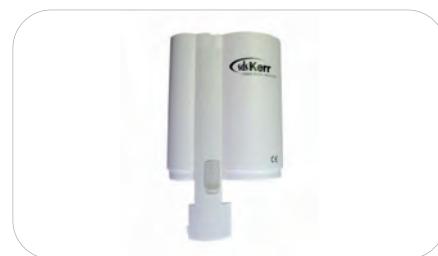
Magazynek wielokrotnego użytku do opakowań Volume