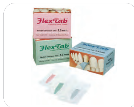
Flexible Clearance Tabs