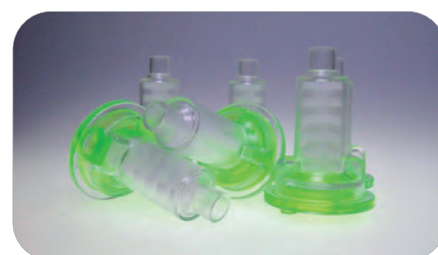
Końcówki typu Dynamic do opakowań Volume