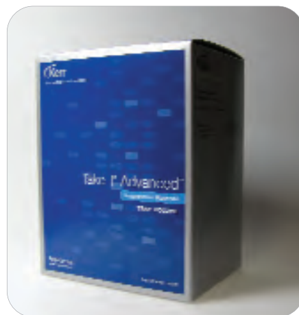
Take 1 Advanced Tray Volume Regular Set 34147