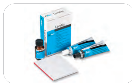
Luralite – pasta wyciskowa

Zawartość: pasta bazowa 215 g, katalizator 65 g, Solitine 28 ml, 1 blok do mieszania.