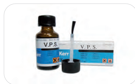
V.P.S. Adhesive 15 ml