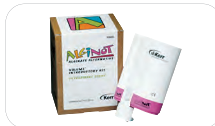
AlgiNot Volume, zestaw wprowadzający 33040