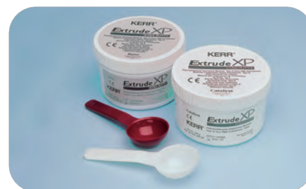
Extrude XP Putty 27877