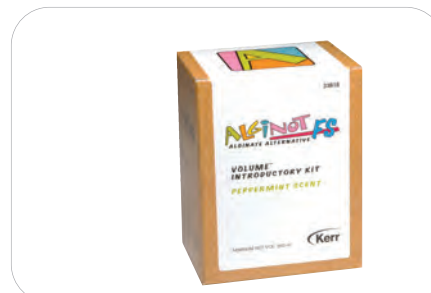
AlgiNot FS Volume Intro Kit 33818