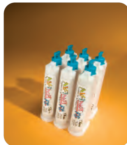
AlgiNot FS Cartridge

Klej do żyłek VPS Adhesive, butelka 60 ml 25777