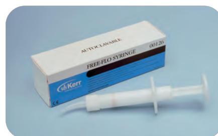
Free Flo Syringe